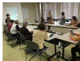
ふれあい文化センター 研修室にて 13時～14時開催風景

12月17日(月)タブレット体験講座を4回開催しました。多くの方に参加していただきました。