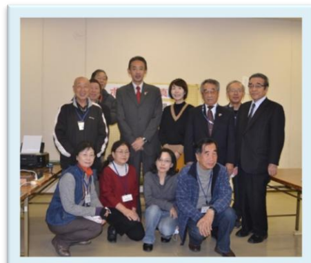
浜田市長の来訪もあり、大いに盛り上がりました。

マイクロソフト社が 2014 年 4 月 9 日にウィンドウズ XP とオフィス 2003 のサポートを終了します。パソコンが動かなくなるわけではありませんが、更新プログラムが提供されなくなり、インターネット接続時にウイルス感染などの危険度が上がります。XP パソコンは買い替え時ですがお悩みの方は第1、第3土曜日開催の DD 相談会にお越しください。