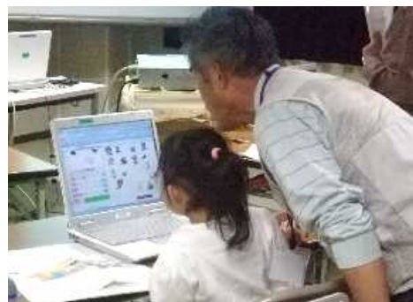
わかるかなあ・・・

難しさもあります。 更にもっと重要なことは日 常、頻度高くパソコンを使用 しない子供に何を習得しても らったらいのかという点で す。 パソコンの楽しさやパソコ ンを通じて基礎学力の重要性 などを無意識の内に感得して ほしいと願ってやりました。 子供たちが講座終了後に見 せてくれた笑顔の中に、そん なこちらの気持ちを少しは受 け止めてくれたのかなと感じ ました。