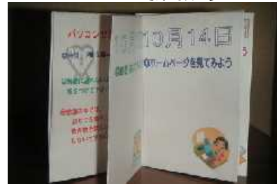
出席するとシールを貼ってもらえる出席表

早く、操作もすぐに会得し、 満点を出す子もいます。 高齢者が苦手なダブルク リックもなんなくこなしま す。あと簡単な文字入力力の練 習と五日間使う出席表を作り ます。どの子もパソコンが好 きに なった よう で、教 える我 々とし ても一 安心で す。