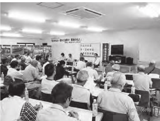
地域班全体班長会議