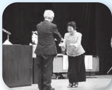
喜寿の祝いを受取る内田会員

10年を目指して体に気を付けて頑張りたいと思います。ありがとうございました。(永年表彰の方)