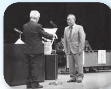
永年表彰を受取る福田会員