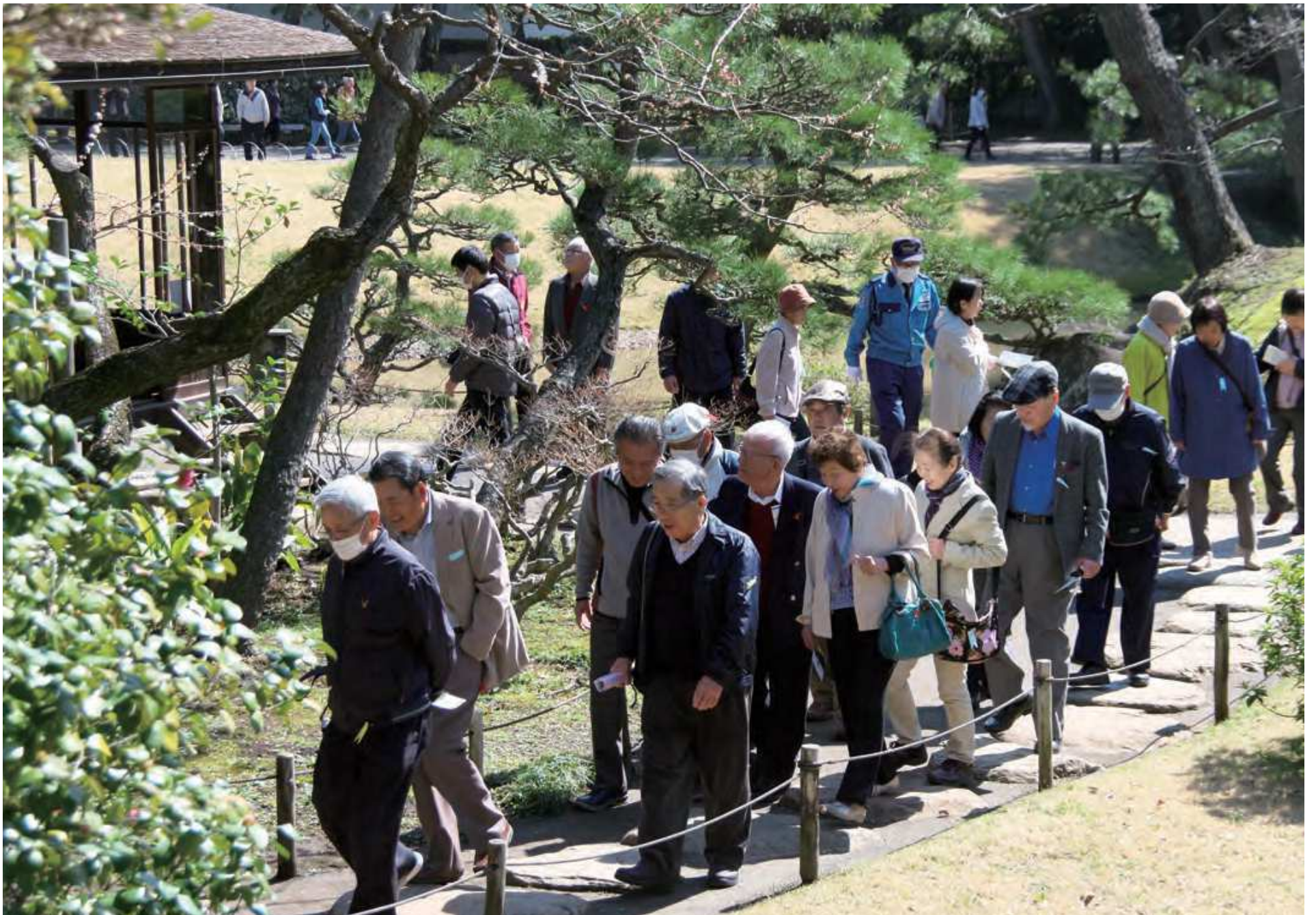
親睦会日帰研修旅行にて撮影（横浜三溪園と横浜中華街）

発行：公益社団法人東松山市シルバー人材センター 発行日：平成30年9月1日 東松山市小松原町17-19 TEL：0493-22-2245 FAX：0493-22-7655