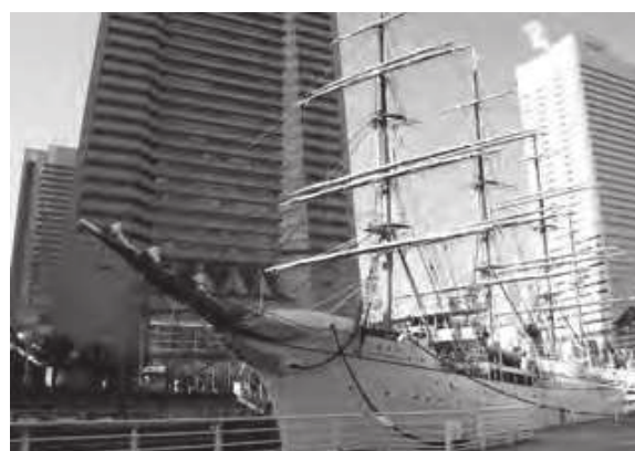
帆船日本丸 (横浜みなと博物館)