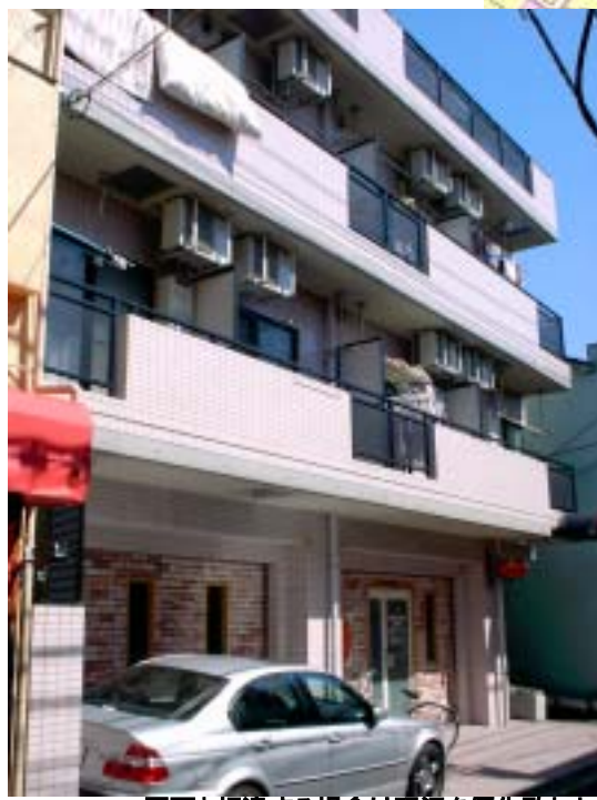
図面と相違する場合は現況を優先致します。