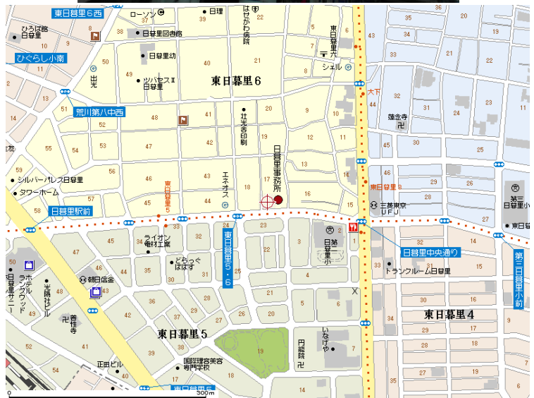
図面と相違する場合は現況を優先致します。