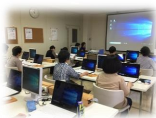
2019.6.4 封筒入り招待状作成講座 講座風景